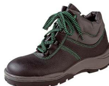
Sicherheits Stiefel S3