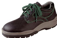
Sicherheits Halbschuhe S3