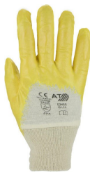
Nitrilhandschuhe m. Strickbund